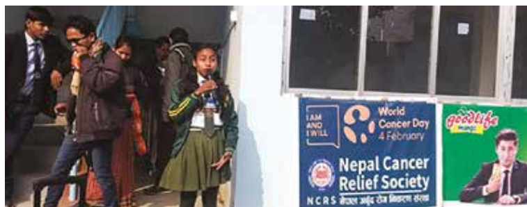
गरिएको छ । नर्सिङ विद्यार्थीको सहकार्यमा क्यान्सरबाट कसरी बच्ने, सुरुआती अवस्थामा क्यान्सर कसरी चिन्ने र उपचार कसरी सहज बनाउन

सिरहा । हरेक वर्ष चार फेब्रुअरीमा मनाइने विश्व क्यान्सर दिवस नेपालमा ‘म हुँ र म गर्न सक्छु’ भन्ने नाराका साथ मनाइएको छ । लहान सगरमाथा एजुकेसनल एकेडेमी प्राची, लहान प्यारागन पब्लिक स्कुल र लहान एभरेस्ट कलेजको सहकार्यमा नेपाल अर्बुद रोग निवारण संस्था लहानमा जनचेतनामूलक न्यालीको आयोजना